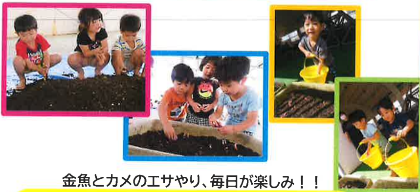
金魚とカメのエサやり、毎日が楽しみ!!

雑巾がけに取り組むことで、自分たちが使った場所を綺麗にしようと思う感謝の気持ちが芽生えます。また、雑巾しぼりは少しでも余分な水をなくそうと、手に目一杯力を入れてしぼったり、雑巾がけは全身を使って掃除をするので、自然と腕や脚の筋肉、体感を鍛えたり、バランス感覚を養うことにつながっています。「やるぞー」と目をキラキラさせて楽しみながら意欲的に取り組んでいます。