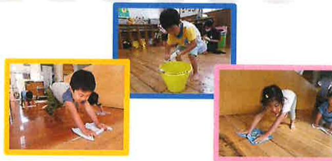
雑巾がけと雑巾絞りに一生懸命だよ!

栽培活動は野菜が育つ過程が見られる大事な食育活動の一つです。子ども達が責任を持って水やりをすることで、生き物の成長を肌で感じるとともに、食べ物への関心や偏食の改善の効果があると知られています。また、土づくりからはじめることで、土の感触を味わったり、ミミズを見つけて興奮したり。「早く水あげたい!」と、屋上の菜園では水を入れた適度な重さのバケツで負荷をかけながらの水やりもがんばっていますよ。